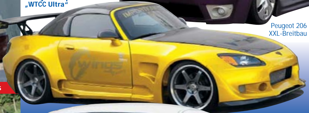
Honda S2000 Mega-Breitbau von C-Wings!