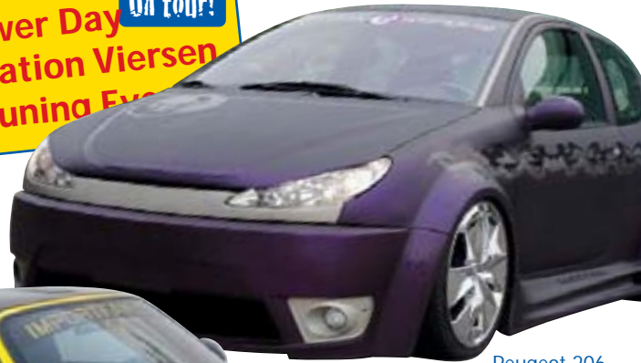
Peugeot 206 XXL-Breitbau