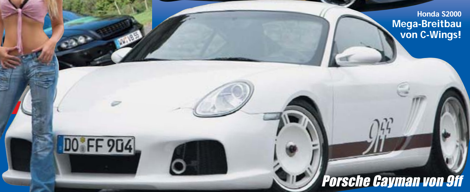
Porsche Cayman von 9ff