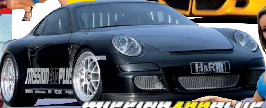
Porsche 997 von H&R