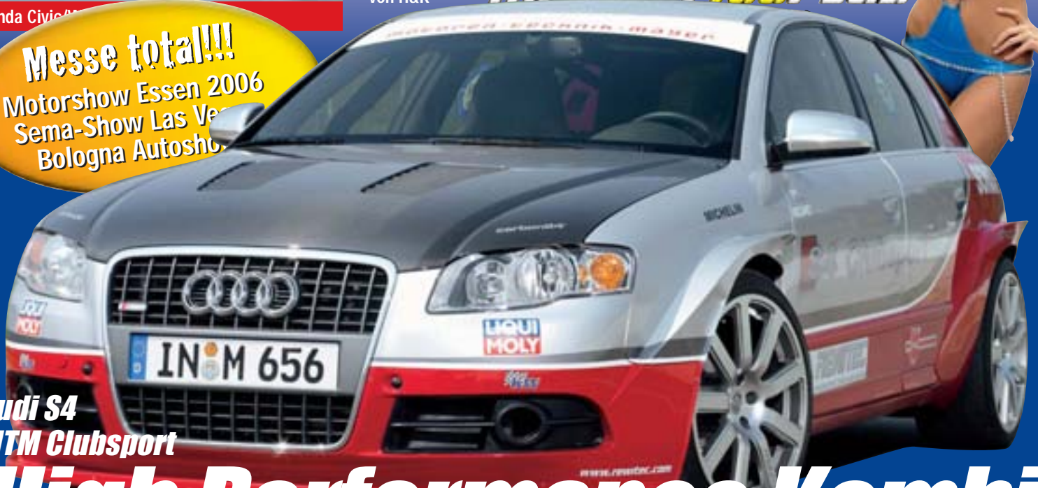
Audi S4 MTM Clubsport

Messe total!!! Motorshow Essen 2006 Sema-Show Las Vegas Bologna Autoshow